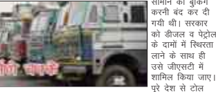
बताया कि शुक्रवार प्रातः छह बजे से ट्रकों का चक्का जाम करने का निर्णय लिया गया है। ट्रक ऑपरेटरों ने दो दिन पहले से ही लंबी दूरी के लिए सामान की बुकिंग करनी बंद कर दी गयी थी। सरकार को डीजल व पेट्रोल के दामों में स्थिरता लाने के साथ ही उसे जीएसटी में शामिल किया जाए। पूरे देश से टोल बैरियर को हटाया जाए। उन्होंने कहा कि केन्द्र सरकार ईंधन की बिक्री पर प्रति लीटर पर आठ रुपये का टेक्स सड़क विकास निधि के नाम पर लेती है, जिससे सरकार को टोल बैरियर की व्यवस्था को समाप्त कर देना चाहिए।

शुक्रवार से अनिश्चितकाल के लिए होने जा रहे इस चक्का जाम में निजी ट्रक ऑपरेटरों में भी उरका साथ देना ही भरोसा दिया है। मौजूदा समय