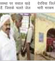
प्रधान उप जेलों की सुरक्षा व्यवस्था पर खास नजर रख रहा है, जहां बाहुबली, माफिया डॉन और कुख्यात गैंगस्टर मौजूद हैं। इसी के भेदनाजर