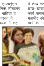
लखनऊ। उत्तर प्रदेश

लखनऊ। राजाजीपुरम स्थित एमआईएस चौराहे के पास नवनिर्मित सार्वजनिक शौचालय का लोकार्पण महापौर डा. संजय गांधिया व क्षेत्रीय विधायक सुरेश कुमार श्रीवास्तव ने किया। इस मौके पर क्षेत्रीय विधायक ने कहा कि लखनऊ परिवहन विभागनसा क्षेत्र में स्वच्छ भारत अभियान के अन्तर्गत 11 शौचालय का निर्माण विभिन्न बस्तियों में कराया जा चुका है। सार्वजनिक शौचालय के लोकार्पण के अलावा पर मयाया विधायक सुरेश कुमार श्रीवास्तव ने का कि क्षेत्र का विकास तेजी से हो रहा है। क्षेत्रीय विधायक ने 18 सड़कों के विस्तार की लागत 1.18 करोड़ है जो बन चुकी है। क्षेत्रीय विधायक ने कहा कि लोकनिर्माण विभाग की आठ सड़कें निर्मित हो चुकी हैं और 27 सड़कों का निर्माण शुरू कराया जाएगा जिसका प्रस्ताव शासन को भेजा जा चुका है। क्षेत्रीय विधायक ने कहा कि कालीचरण इण्टर कॉलेज