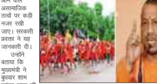
महानिदेशक को निर्देश दिए कि कांवड़ यात्रा वाद क्षेत्रों के थानाखसों को कांवड़ समितियों से बैठक कर उन्हें तय कर दें एवं क्या न करें के समन्वय में आवश्यक दिशा-निर्देश है।

उन्होंने कहा कि कांवड़ यात्रियों को प्रतिबिंबित रूप से हथियार प्रदर्शित साथ में लाने के निर्देश धानाखस कांवड़ समितियों की बैठक के दौरान अवश्य है। उन्हें सौहार्दपूर्ण वातावरण में कांवड़ यात्रा निकालने के लिए प्रेरित किया जाए। उन्होंने कांवड़ यात्री के छद्म केश में आने वाले असामाजिक तत्वों पर सखी रखने के भी निर्देश दिए। उन्होंने कहा कि कांवड़ यात्रियों को अपने साथ आनंद प्रदान करने के लिए प्रेरित किया जाए, ताकि किसी संघटन की दशा में उनकी पहचान की जा सके।