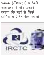
के भारत दर्शन ट्रेन कई बार चलायी गयी, लेकिन इस बार गोवा के साथ ही मैसूर, बेंगलूर, हदमी, शिर्डी व उज्जैन की सेर करने का निर्णय लिया गया है। इस दूर पैकेज के तहत भारत दर्शन

लखनऊ। राजधानीवासियों के लिए अकरी खरीद यह है कि भारतीय रेल खानाना व पर्यटन निगम (आईआरसीटीसी) के सुधार को गोवा के साथ कई महत्वपूर्ण पर्यटन स्थलों की सेर करने के लिए बुधवार को नया दूर पैकेज लॉन्च किया। भारत दर्शन ट्रेन 31 अगस्त को रवाना होगी और 11 सितंबर को वापस लौटेगी। 11 रात व 12 दिन के इस दूर पैकेज में प्रति यात्री 11340 निश्चित किया गया है। इस दूर पैकेज की बुकिंग शुरु हो गयी है। यह जानकारी बुधवार को भारतीय रेल खानाना व पर्यटन निगम के उच्च क्षेत्र के मुख्य क्षेत्रीय