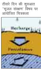
तीसरे दिन की शुरुआत