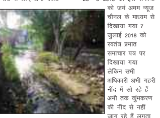
उपलब्ध नहीं है यह रोंड बने लामक नहीं है यहां पर नालियां भी नहीं बनी हुई है जिससे नालियों में जलनगर रहता है इसी जलनगर के बीच से लोग

चूक विभाग के जर्जें आए हुए थे तो उन्होंने बताया कि इस रोंड के लिए अभी बजट