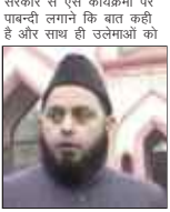
भी ये निर्देश दिए हैं कि वे भी इस तरह के कार्यक्रमों में शामिल न हों। यही नही मौलाना ने प्रेस कॉन्सिल ऑफ इंडिया और मौलाना ने कहा कि इन्ही

लखनऊ। गत दिनों अमीनाबाद इन्टर कालेज की घटना को देखते हुए राजधानी के समस्त विद्यालयों में किसी भी बाहरी व्यक्ति के प्रवेश पर रोक लगा दी गयी है। इस संबंध में डीआईओएस ने निर्देश जारी कर दिए हैं। ज्ञात हो गत दिनों मंडलिंग में सिलेक्शन का झांसा देकर जालसाज ने अमीनाबाद इन्टर कालेज के दो विद्यार्थियों व दो शिक्षकों को तीन सौने की फेन ताला चार हजार रुपए ठग लिए थे तथा नीला देखाकर फतार हो गए। यह सब करने के लिए जालसाज ने प्रधानाचार्य को झांसे में लेकर मैदान में टेंट लगाकर पूरा नाटक किया।