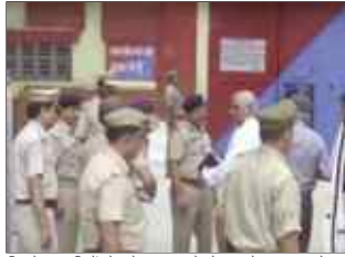
पिछले कुछ दिनों से प्रदेश की कई जेलों में हुई घटनाओं को लेकर प्रदेश सरकार बेहद गंभीर है और इसी के चलते