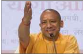
मेडिकल कॉलेजों की स्थापना

वर्तमान जिलाक्यूएफएल अस्पतालों से जुड़े नए