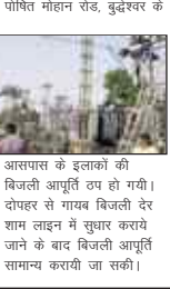
आसपास के इलाकों की बिजली आपूर्ति ठप हो गयी। दोपहर से शाम बिजली बंद होने के बाद बिजली आपूर्ति सामान्य करायी जा सकी।

रही। उधर भीषण गर्मी व उमस के चलते शहर के अधिकतर इलाकों में दिनभर लोग बिजली की आवाजाही व ट्रिपिंग से बेहाल रहे। गुरुवार को दोपहर में काकोरी एफसीआई उपकेन्द्र से निकलने वाले बुद्धेश्वर फीडर की लाइन के तारों से एक कौआ टकरा गया जिससे तेज धमाके के साथ 11 केबी लाइन करीब आधा दर्जन स्थानों पर क्षतिग्रस्त हो गयी। लाइन के क्षतिग्रस्त होने से