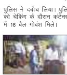
पुलिस ने आगरा