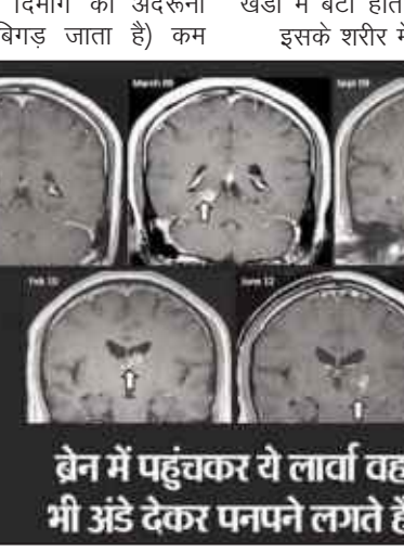
ब्रेन में पहुंचकर ये लार्वा तहां भी अंडे देकर पनपने लगते हैं।